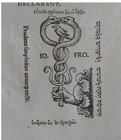
Marca tip., cop. CCLA, 20160310