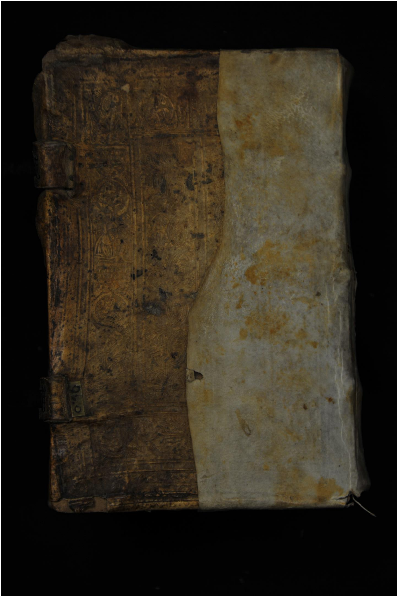
Piatto post., cop. CCLA, 20160205